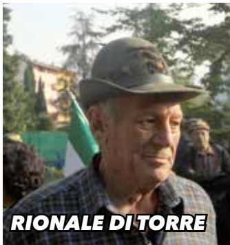
RIONALE DI TORRE

pini, Battaglione Val Tagliamento in qualità di mitragliere. È stato molto attivo nella musica tanto che ha voluto al suo funerale oltre agli Alpini anche la banda cittadina. Le esequie, accompagnate dalle note del Silenzio, si sono svolte nella parrocchiale di Prata alla presenza di tutti i Gagliardetti della Zona Bassa Meduna. Il Gruppo Alpini di Prata esprime alla famiglia le più sentite condoglianze.